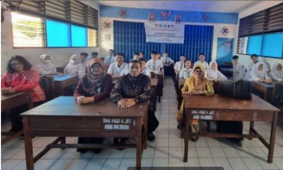
Saat kegiatan dikelas belum dimulai tampak Tim PKM duduk dan menunggu untuk di persilahkan oleh panitia