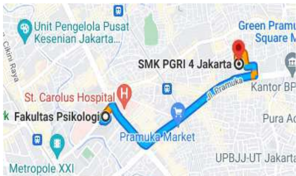
Gambar 1. Lokasi Mitra

SMK PGRI 4 Jakarta memiliki Robel sebanyak 7 kelas dengan Kelas X berjumlah 3 kelas , Kelas XI berjumlah 2 Kelas dan kelas XII berjumlah 2 kelas dengan prodi Akuntansi, pemasaran, Perkantoran dan Bisnis