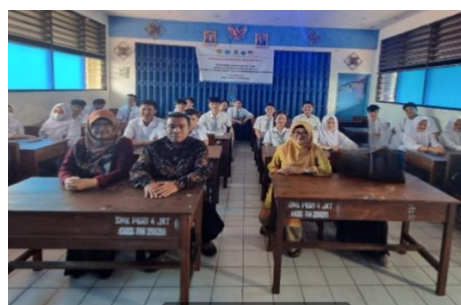
Gambar 3. Saat kegiatan akan dimulai dikelas

Metode pelatihan dilakukan untuk mempraktekkan penggunaan aplikasi chatGPT. Dalam pelatihan ini siswa mencoba untuk mencari informasi yang untuk menambah wawasan dalam dunia kerja