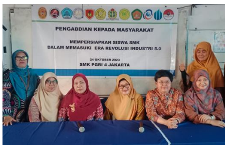
Gambar 2. foto saat pembukaan kegiatan

Pelaksanaan kegiatan pengabdian kepada masyarakat telah dilakukan pada tanggal 24 Oktober 2023 dengan peserta Siswa kelas XI Prodi Manajemen Perkantoran & Layanan Binsis berjumlah 34 orang. Pelaksaaan kegiatan ini menggunakan metode penyuluhan dan pelatihan.