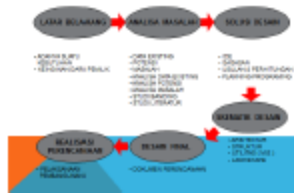
Gambar 1. Diagram Alir Proses Perencanaan (olah peneliti dari beberapa sumber)

Proses perancangan harus memberikan pemikiran yang logikal dan kerja tim yang baik dalam menciptakan sebuah desain, dapat memberikan informasi yang jelas tentang desain, memberikan solusi alternatif yang terbaik, serta menjelaskan solusi tersebut kepada klien (Booth, 1963)