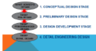
Gambar 2. Pekerjaan Disain dalam Perencanaan (olah peneliti dari beberapa sumber)

Tahap Detil Desain: Membuat gambar detil disain, menyusun spesifikasi teknis, menyusun Rencana Anggaran Biaya (RAB), menyusun bill of quantity (volume dan kuantitas pekerjaan) membuat laporan akhir... out put: Dokumen album gambar (bestek.) Dokumen RAB dan analisa rind spesifikasi teknis, perhitungan RKS, perhitungan engineering