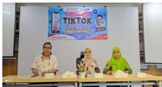
Workshop 2: "TikTok, Senjata Rahasia Tingkatkan Omset Penjualan".