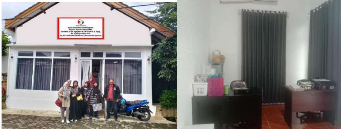
Gambar 1. Foto Kantor dan Ruangan Klinik Bisnis GEMMA

Metode Pendekatan ini, ditujukan untuk mentrasfer ilmu pengetahuan dan teknologi, agar mitra mampu mempraktekan hasil dari pendekatan pelatihan dengan Bimbingan Teknis dan Pendampingan dari pakarnya (tim), dimana metode pendekatan ini dilaksanakan langsung di tempat pelatihan.