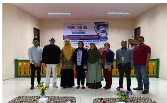
Workshop 4: Grand Launching Portal E-commerce Ukmorganizer.co.id : Mewujudkan "UMKM Naik Kelas" Melalui Teknologi dan Kolaborasi.