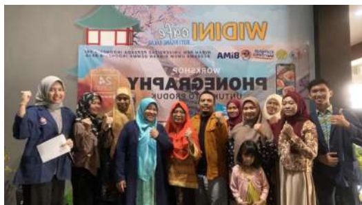
Workshop 1 Phone Graphy Sebagai Upaya Peningkatan Pemasaran Digital Produk UMKM Binaan GEMMA Indonesia Raya, Depok