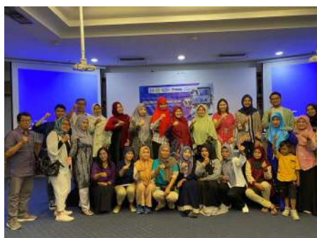
Workshop 3: Literasi Keuangan dan Permodalan pada UMKM Binaan Yayasan GEMMA Indonesia Raya