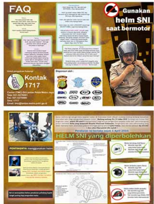
Gambar 3 Booklet Kampanye Penggunaan Helm SNI