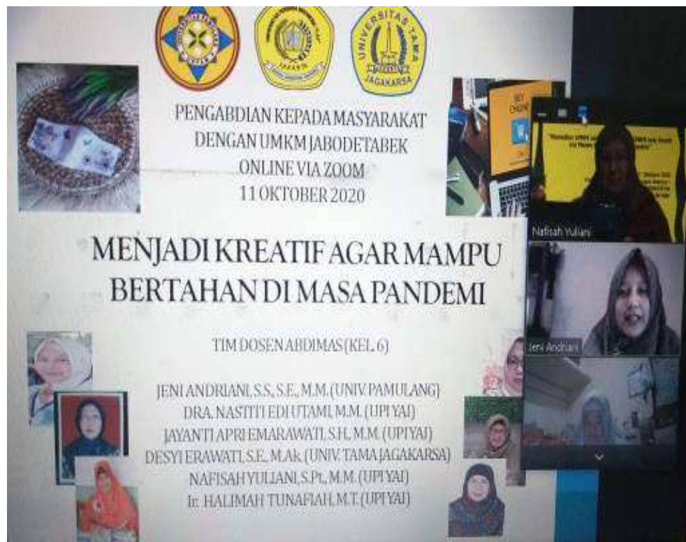
Gambar 3. Presentasi Pembicara Kelompok 6