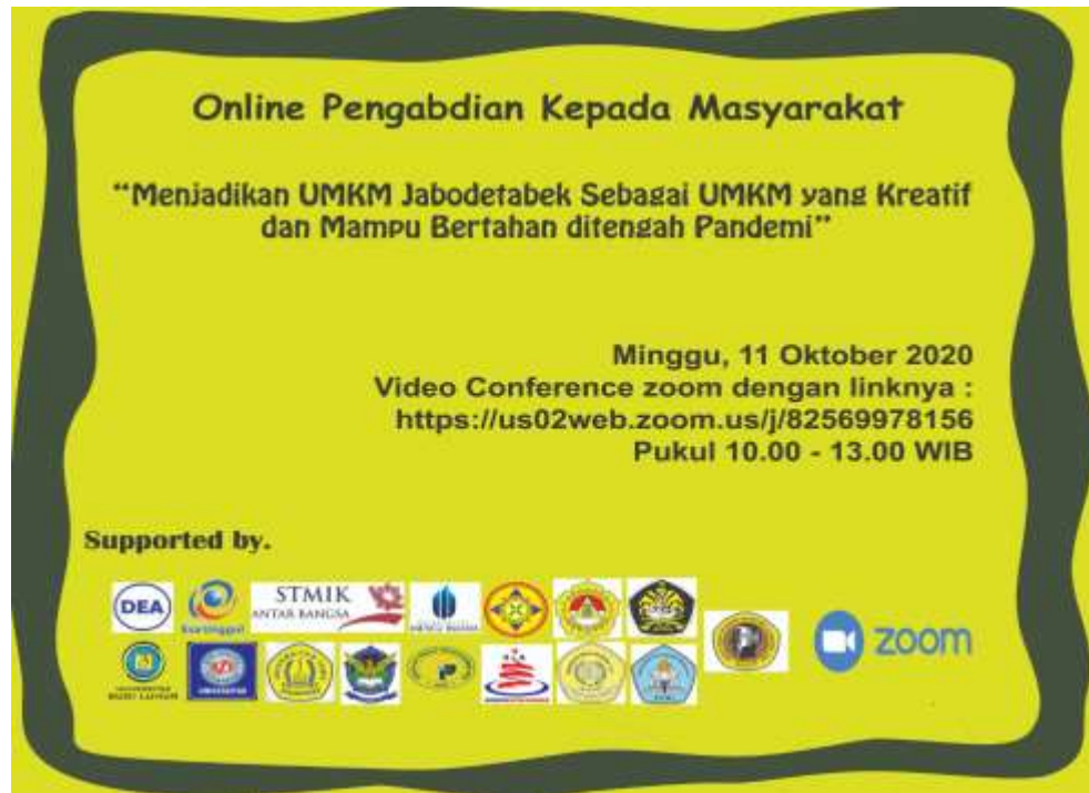
Gambar 2. Flyer Kegiatan Pengabdian Pada Masyarakat