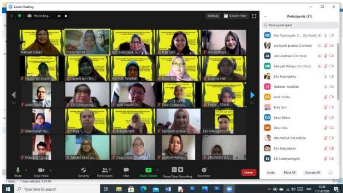
Gambar 6. Peserta Kegiatan Pengabdian Pada Masyarakat 2