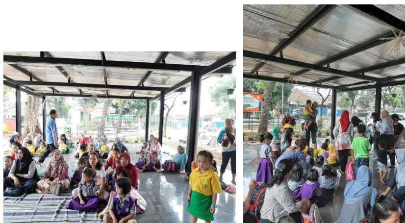
Gambar 3.1 Kegiatan abdimas

Selama mengerjakan tugas mewarnai anak-anak tersebut didampingi oleh guru PAUD dan orang tua. Untuk mendorong anak-anak tersebut menyelesaikan tugasnya, tim dosen DKV dibantu 3 mahasiswa memberikan pengarahan dalam pemilihan warna dan memberikan kebebasan bagi mereka untuk menggunakan warna sesuka hati.