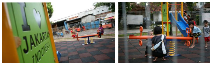
Gambar 1.2 Area bermain anak-anak