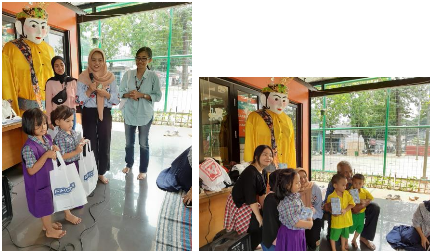
Gambar 3.3 Para pemenang mewarnai gambar

Setelah pembagian hadiah, acara dilanjutkan dengan foto bersama dan pembagian boks makan siang untuk anak-anak, guru, pengurus, dan orang tua.