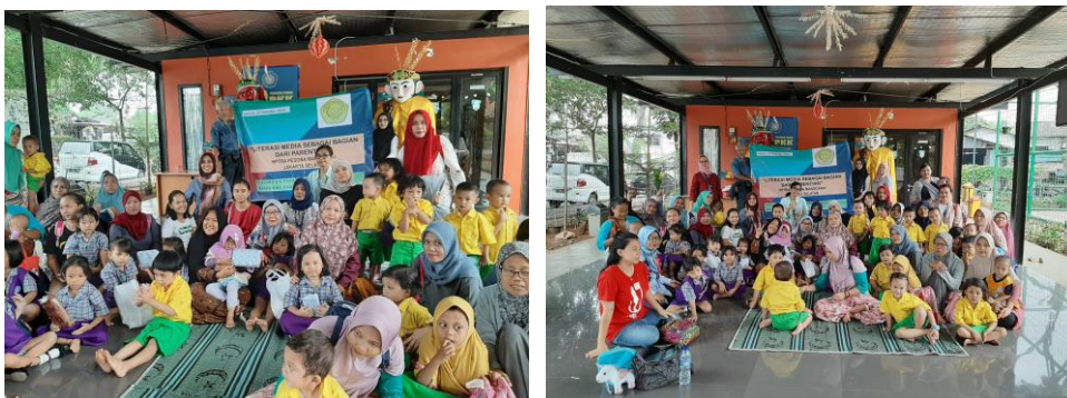
Gambar 3.4 Foto bersama dengan anak-anak peserta abdimas, orang tua, guru PAUD, dan pangurus RPTRA Pesona Manggarai