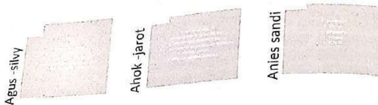
Gb 3. Pesan yang di share melalui akun twitter

Berdasarkan pesan yang diekspose oleh ketiga pasangan dapat diklasifikasikan sebagai berikut :