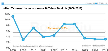
Gambar 1.2. Inflasi tahun 2008-2017