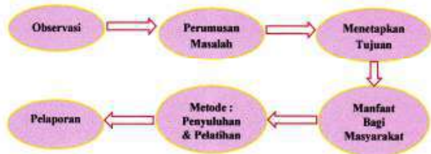
Gambar 1. Road Map Kegiatan Pengabdian Masyarakat

Tahapan-tahapan yang dilalui dalam melaksanakan kegiatan PKM ini sebagai berikut: