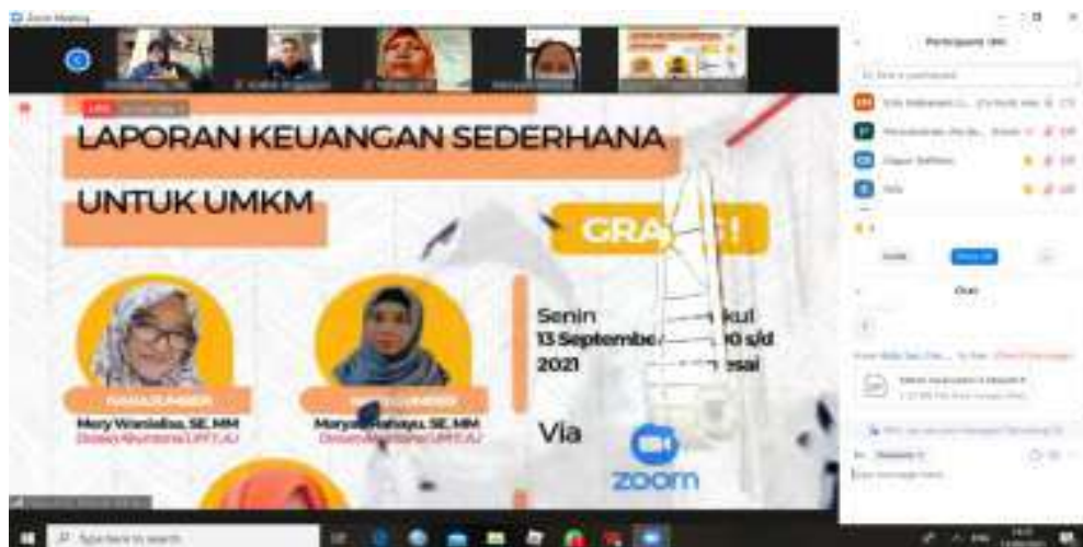
Foto Peserta Webinar