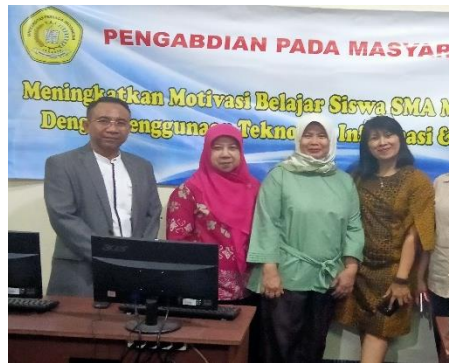
Gambar 3. Tim Pengabdian Masyarakat UPI YAI