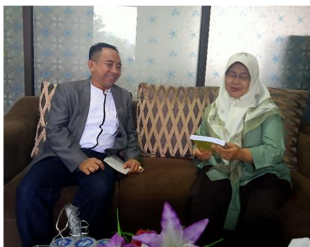
Gambar 2. Diskusi awal Tim Pengabdian dengan Kepala Sekolah SMA I

hal tersebut. Sedangkan untuk membahas tentang perhitungan pajak diperlukan Guru yang memiliki kompetensi tentang hal perpajakan, akan tetapi di SMA pada umumnya tidak memiliki Guru dengan kompetensi tersebut. Selain itu juga bahwa ujian akhir semester akan diadakan pada awal bulan Desember. Setelah wawancara dan berdiskusi dengan kepala sekolah maka Tim pengabdian masyarakat dosen-dosen LPT YAI di minta untuk dapat memberikan pencerahan tentang perhitungan pajak, dan cara mengimplementasikan dengan e-pajak, karena saat ini semua berorientasi elektronik.