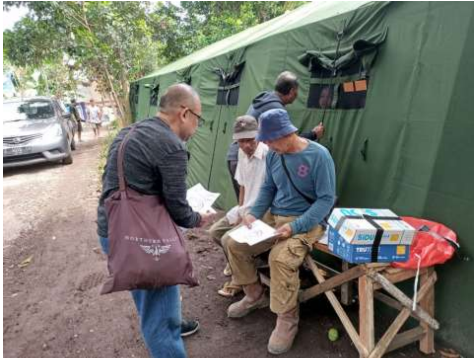
Pembagian Modul Kepada Warga