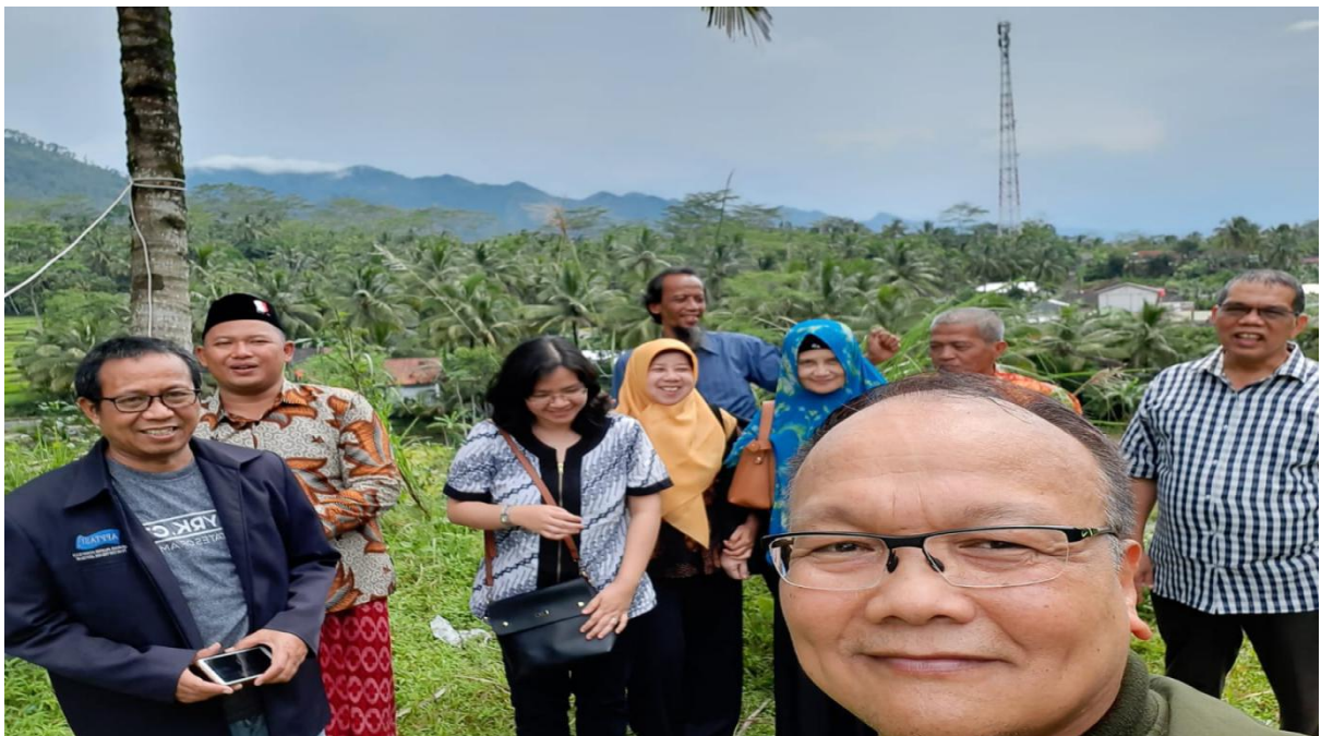
Foto 6 Halaman Belakang SMP Madani