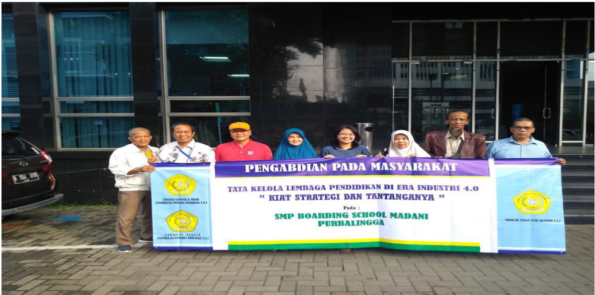
Foto 1 Berangkat Menuju Probalingga dari kampus