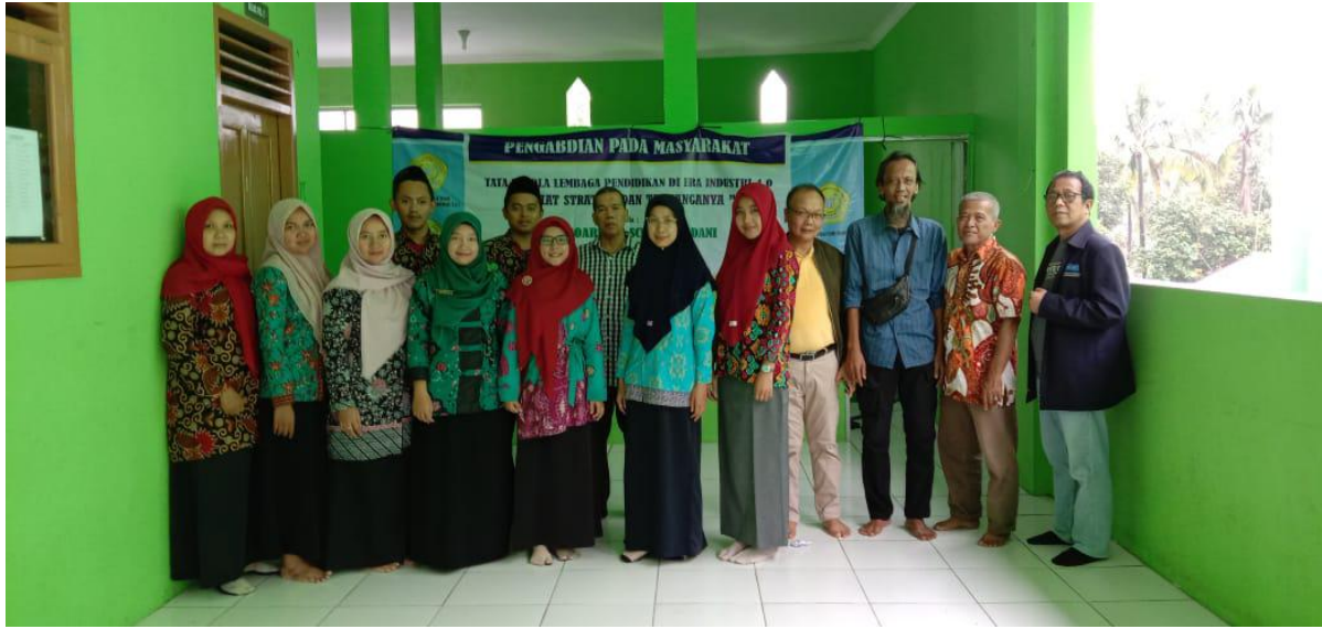
Foto 4 Bersama dengan bapak ibu guru