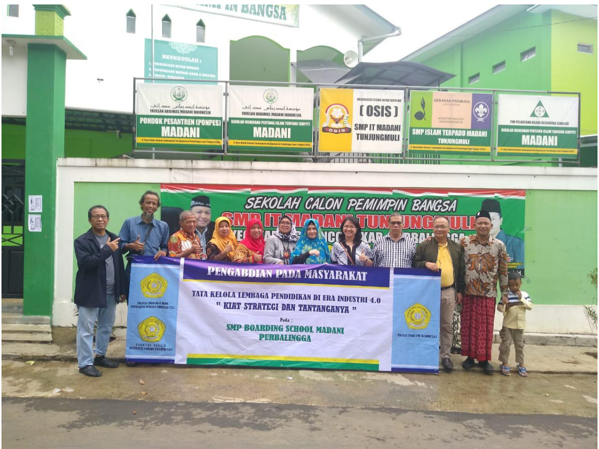
Foto 8 Foto bersama dengan pimpinan SMP Madani sebelum kembali ke Jakarta