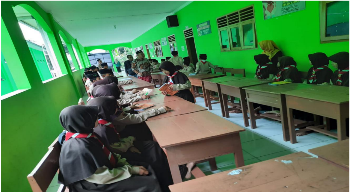
Foto 2 Pelaksanaan SMP Madani Purbalingga