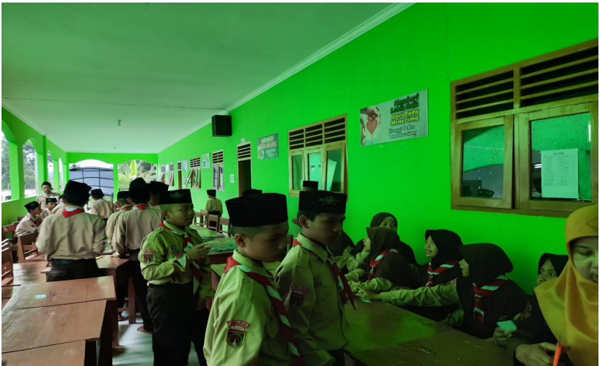
Foto 3 Pelaksanaan Penelitian SMP Madani Purbalingga