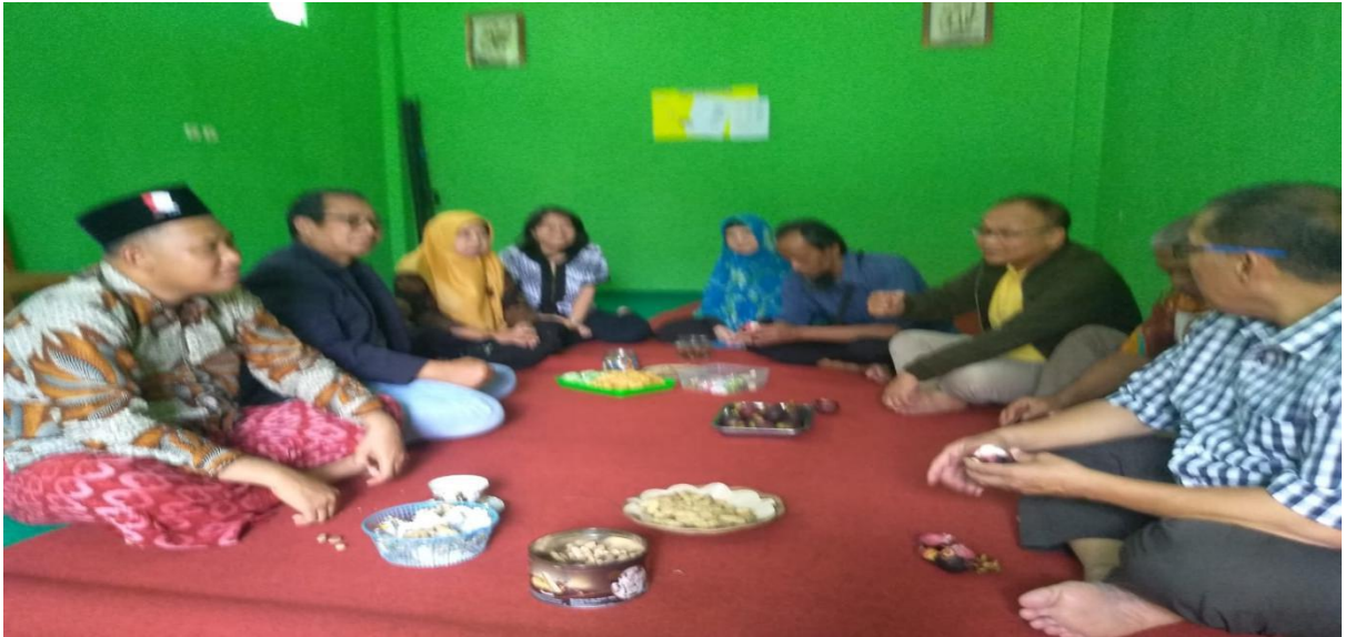
Foto 7 Pertemuan dengan pimpinan SMP Madani