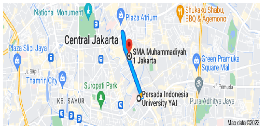
Gambar 1. Lokasi Mitra

Jarak antara lokasi mitra dengan Kampus Universtas Persada Indonesia YAI sebesar 3 KM. dengan waktu tempuh menggunakan kendaraan +- 15 menit.