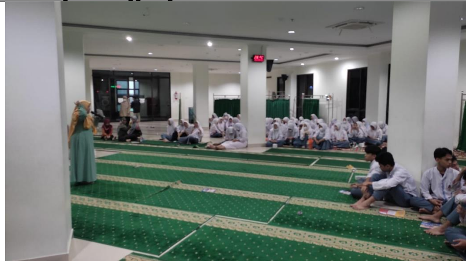
Siswa dengan serius memperhatikan saat dosen memberi penyuluhan.