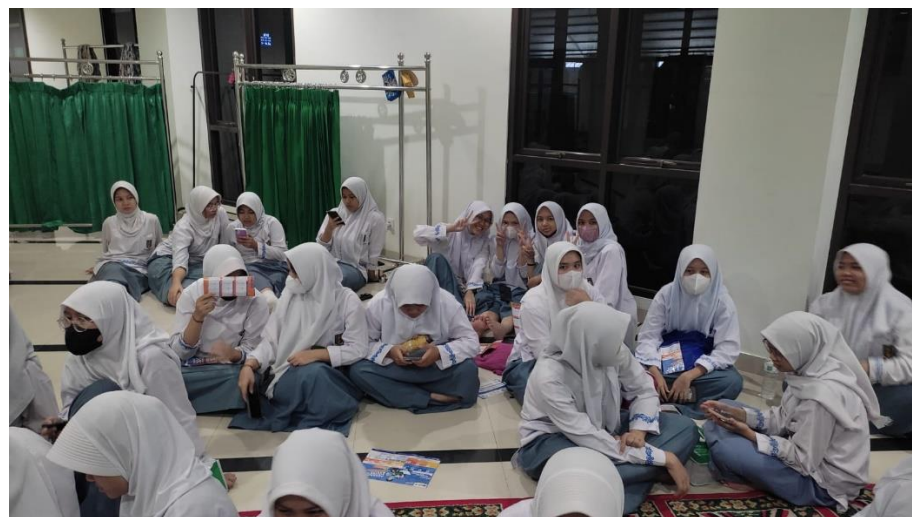
Saat Ice breaking Siswa di minta untuk berkelompok dan berdiskusi dalam sebuah permainan yang di pandu oleh Tim Dosen dari Psikologi UPI YAI,