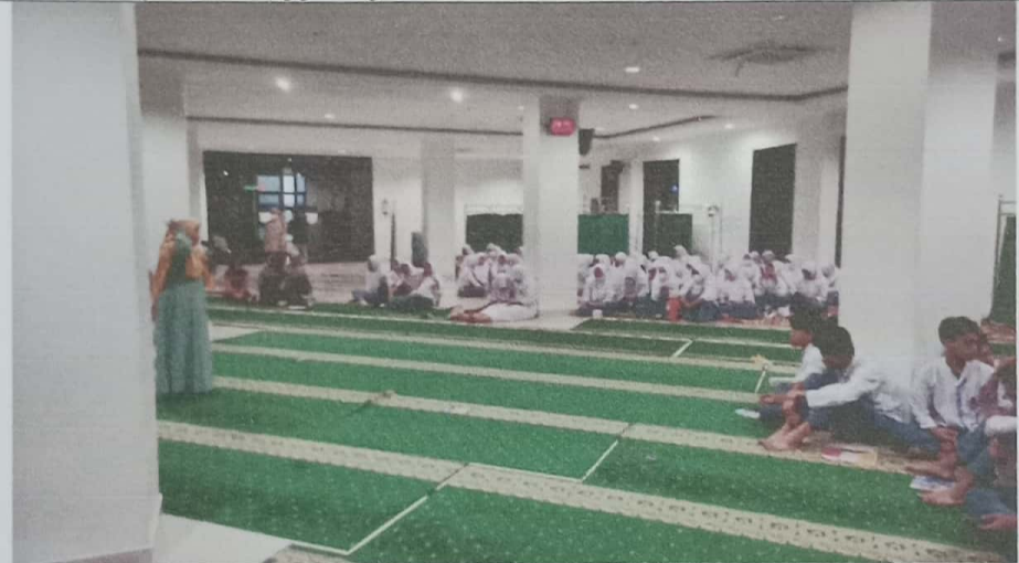
Siswa dengan serius memperhatikan saat dosen memberi penyuluhan.