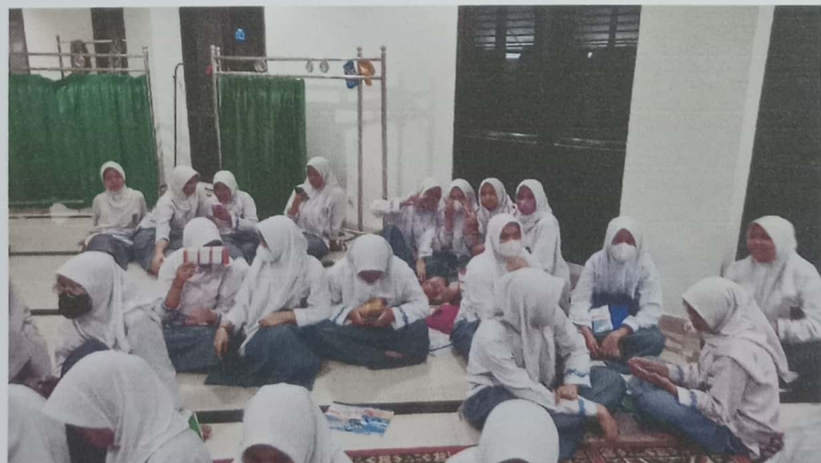
Saat Ice breaking Siswa di minta untuk berkelompok dan berdiskusi dalam sebuah permainan yang di pandu oleh Tim Dosen dari Psikologi UPI YAI,