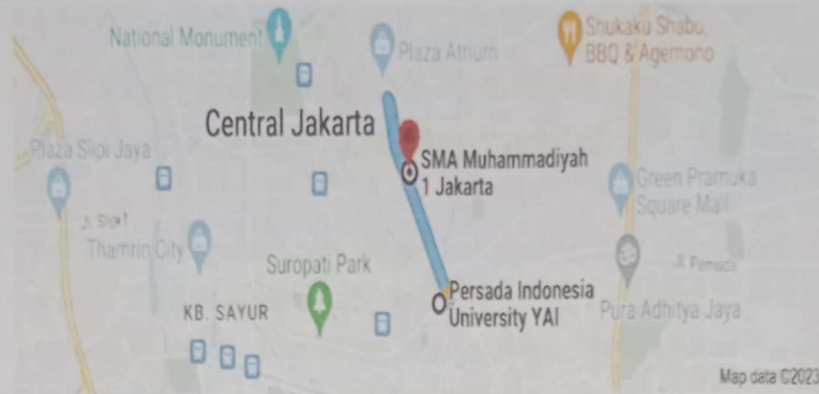
Gambar 1. Lokasi Mitra