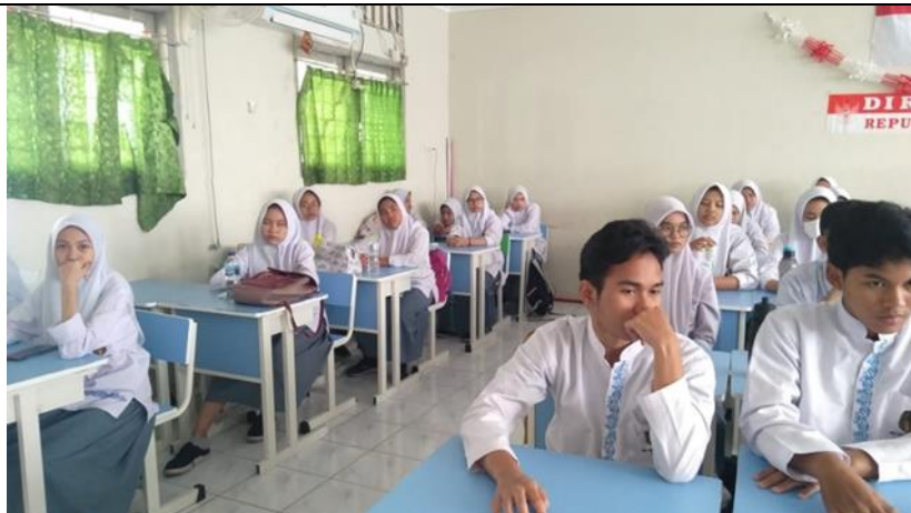
Siswa tampak Serius mendengarkan saat dosen / narasumber sedang mempresentasikan materinya