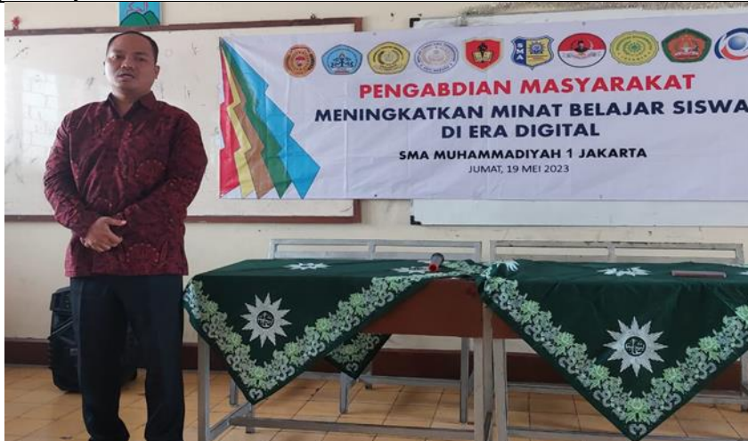
Saat pembukaan kegiatan PKM , tampak Kepala Sekolah SMA Muhammadiyah 1 Jakarta, saat memberikan sambutan dan mengucapkan terima atas ilmu yang akan diberikan pada anak didiknya