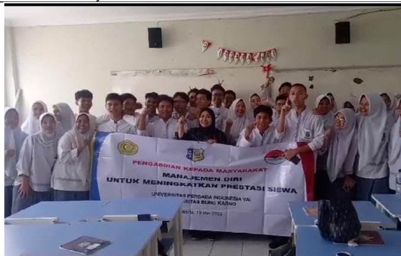
Setelah selesai penyajian materi untuk Siswa Tampak Menyempatkan berfoto bersama dengan siswa