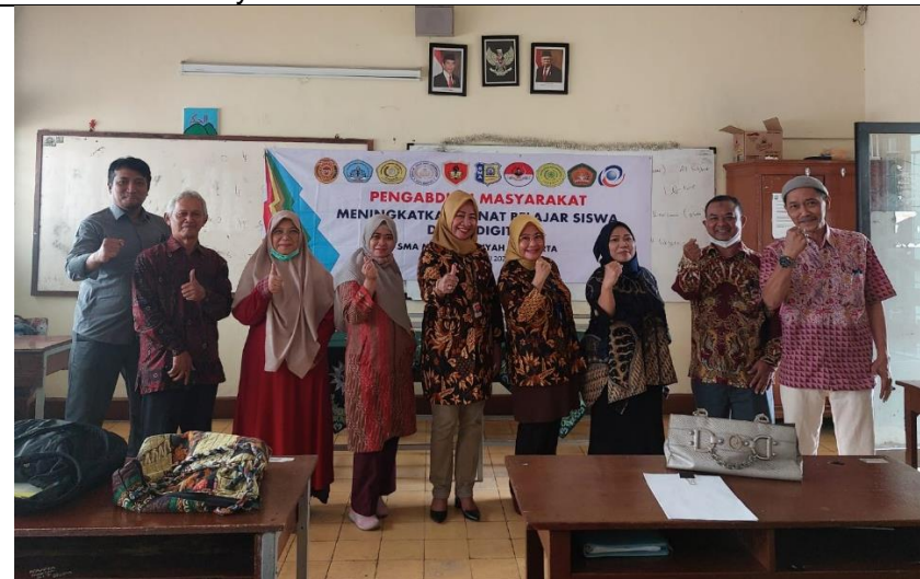
Sesaat setelah pembukaan selesai. berfoto bersama