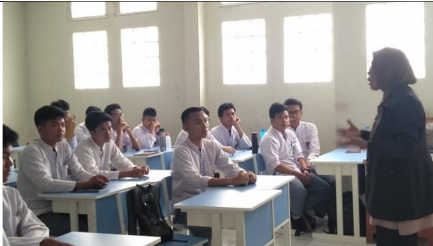
Tampak Narasumber Sedang Mempresentasikan Materi MANAJEMEN DIRI UNTUK MENINGKATKAN PRESTASI SISWA