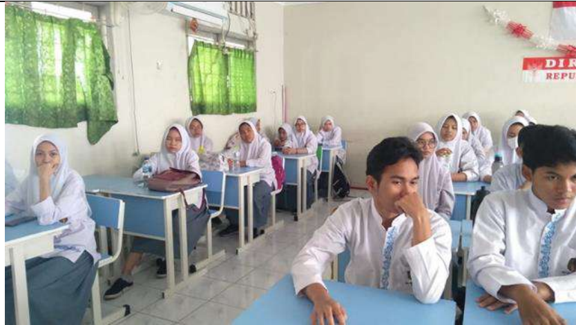
Siswa tampak Serius mendengarkan saat dosen / sedang mempresentasikan materinya