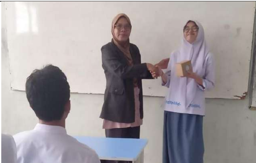
Kepada Siswa yang dapat menjawab pertanyaan dengan benar, diberi souvenir sebagai kenangan.