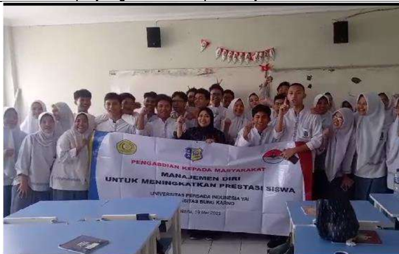
Setelah selesai penyajian materi untuk Siswa Tampak Menyempatkan berfoto bersama dengan siswa