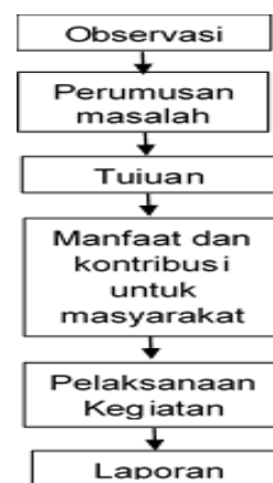
Gambar 1. Alur Kegiatan PKM

Alur kegiatan PKM yang telah dilakukan sebagai berikut: