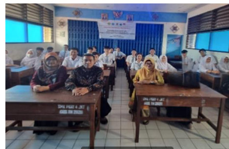
Gambar 3. Saat kegiatan akan dimulai dikelas

Metode pelatihan dilakukan untuk mempraktekkan penggunaan aplikasi chatGPT. Dalam pelatihan ini siswa mencoba untuk mencari informasi yang untuk menambah wawasan dalam dunia kerja