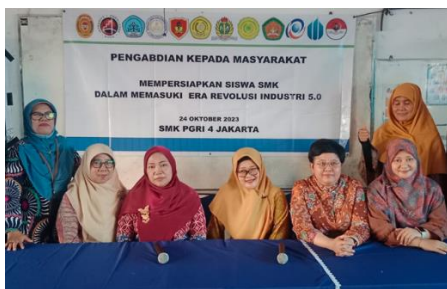
Gambar 2. foto saat pembukaan kegiatan

Pelaksanaan kegiatan pengabdian kepada masyarakat telah dilakukan pada tanggal 24 Oktober 2023 dengan peserta Siswa kelas XI Prodi Manajemen Perkantoran & Layanan Binsis berjumlah 34 orang. Pelaksaaan kegiatan ini menggunakan metode penyuluhan dan pelatihan.